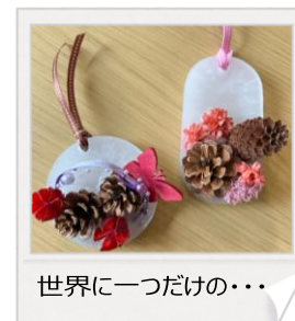
世界に一つだけの...

好きなお花を選んで、自由にレイアウト。 自分オリジナルのワックスバーをお部屋に 飾りませんか？